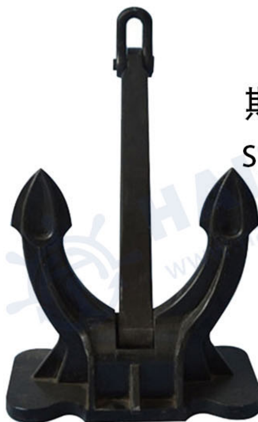
斯贝克锚 Spek Type Anchor