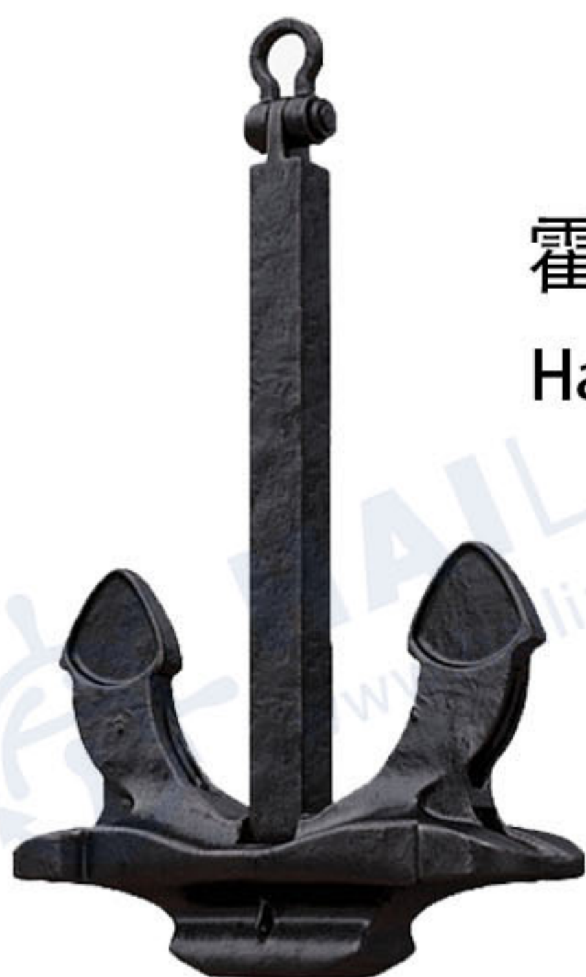
霍尔锚 Hall Anchor